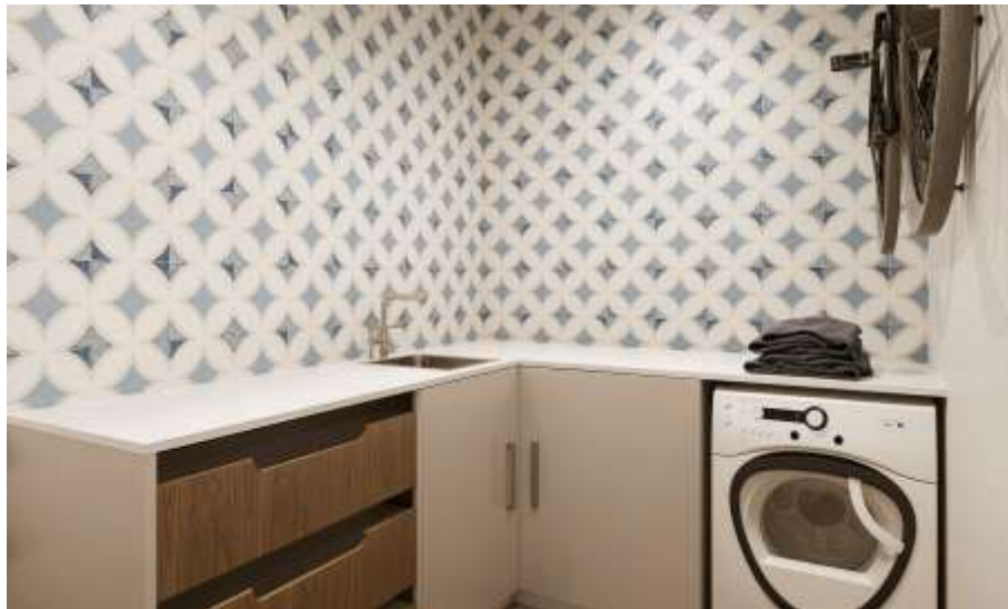
Imagem 3D Urbiceira 64