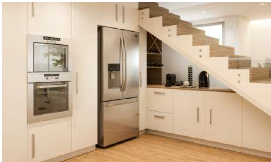
Imagem 3D Urbiceira 64