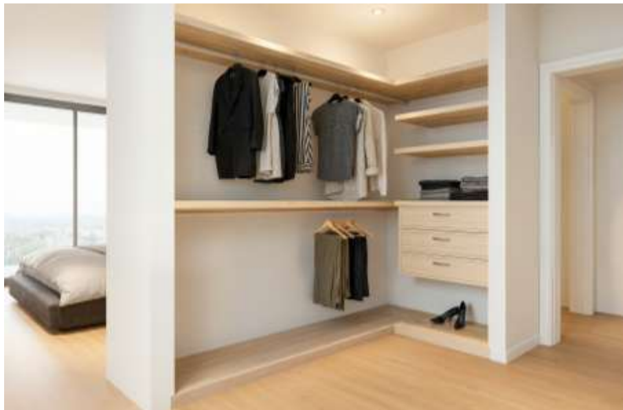
Imagem 3D Urbiceira 64