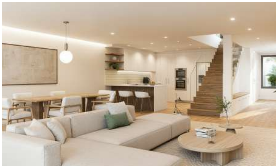
Imagem 3D Urbiceira 64

Gavetas em termolaminado na cor branco mate e tampo e termolaminado na cor "carvalho".