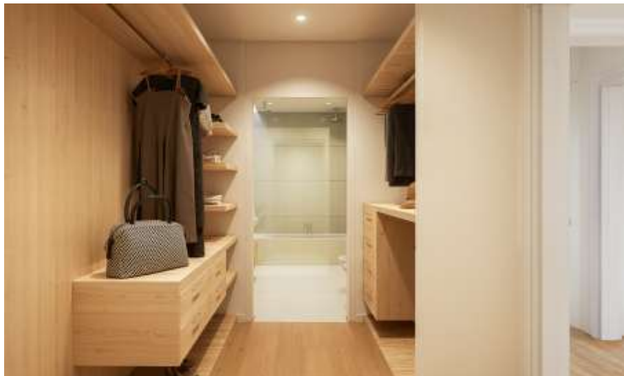
Imagem 3D Urbiceira 64