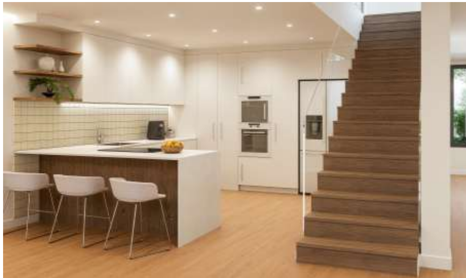
Imagem 3D Urbiceira 64