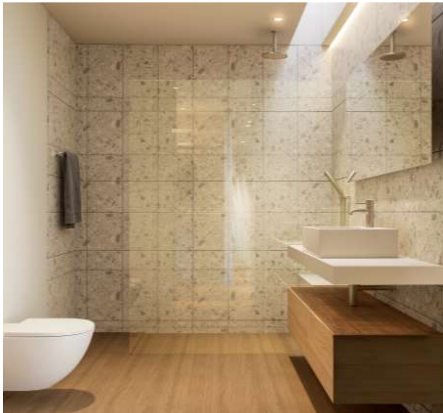
Imagem 3D Urbiceira 64