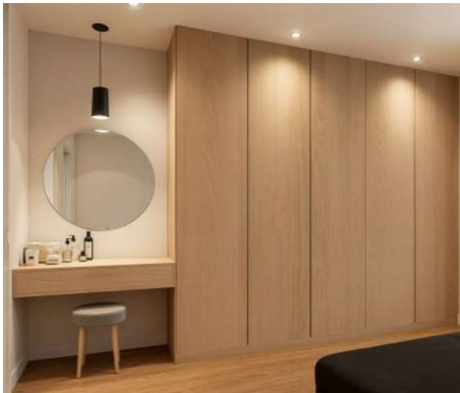
Imagem 3D Urbiceira 64