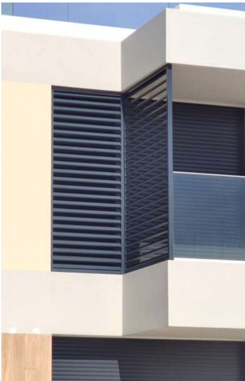
Fotos de moradia na mesma Urbanização