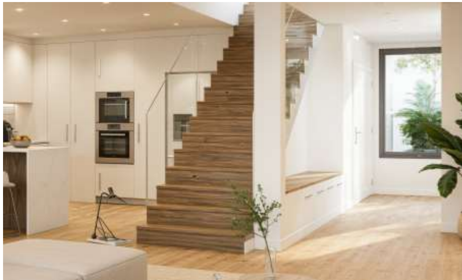
Imagem 3D Urbiceira 64