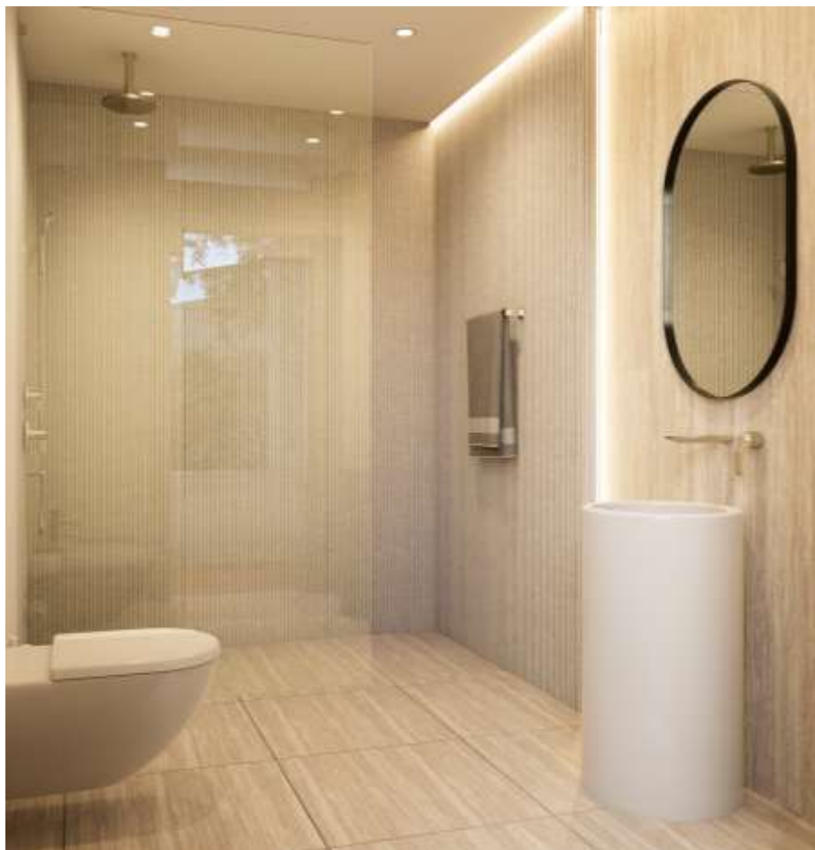
Imagem 3D Urbiceira 64