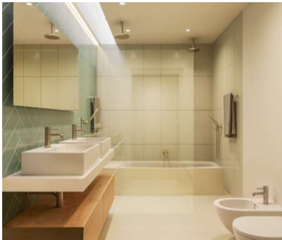
Imagem 3D Urbiceira 64