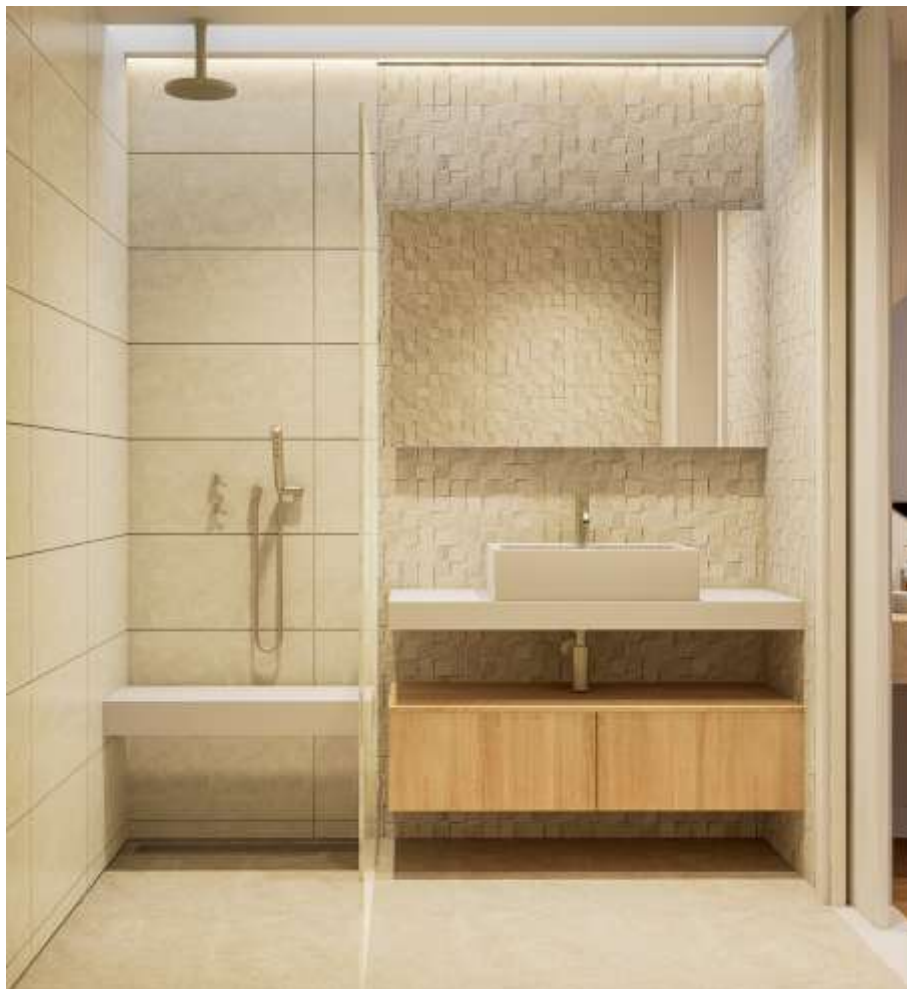
Imagem 3D Urbiceira 64